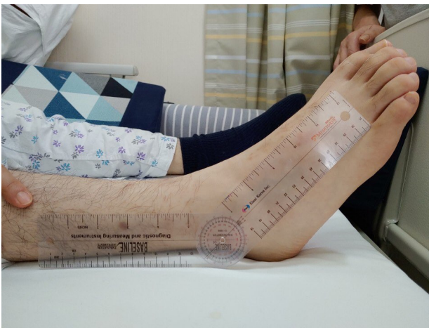
Fig. 1. Measurement of ankle joint range of motion.

*Cut off value for the diagnosis of neuropathic pain is a total score of 4/10.